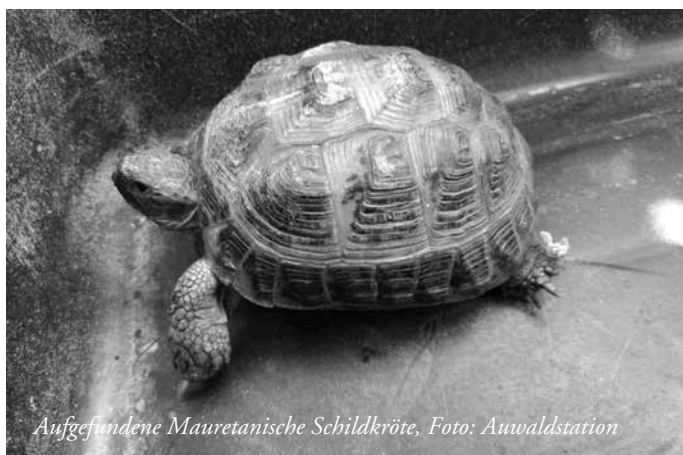
Aufgefundene Mauretanische Schildkröte, Foto: Auwaldstation

Im Juni 2020 berichtete der Auenkurier über eine kapitale exotische Gelbwangenschmuckschildkröte, die 2018 von aufmerksamen Parkbesuchern im Hundewasser entdeckt wurde. Und wie in den folgenden Jahren kann das Tier, da äußerst standorttreu, auch in diesem Jahr wieder beobachtet werden. Anfangs geheim gehalten, ist jetzt ein regelrechter Trampelpfad zum besten Blick auf den Sonnenplatz der Schildkröte entstanden. Ursprünglich sind die Schmuckschildkröten in den mittleren und südlichen USA beheimatet, genießen die Sonne von Florida.